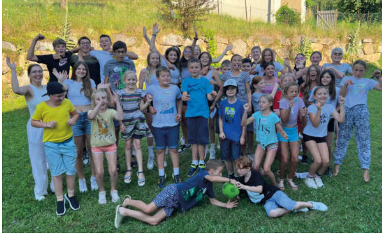
Seelsorgeraum Minilager-Treffen