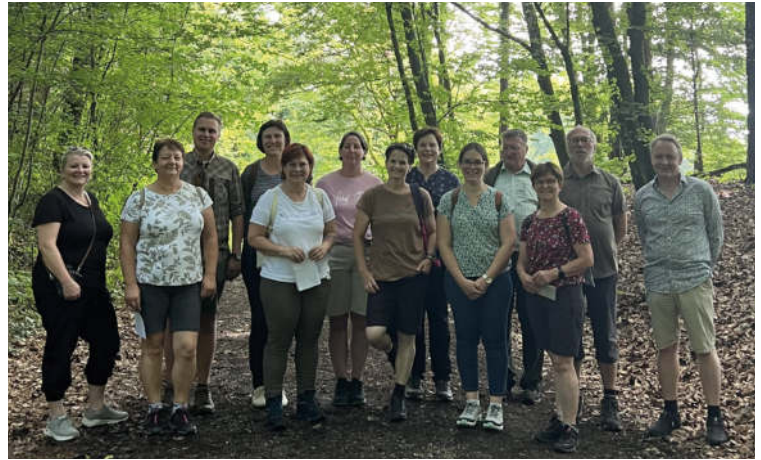
Abschluss Sekretäre in der Region