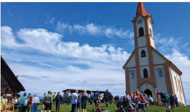
Radwallfahrt, Foto: Alexander Suppan