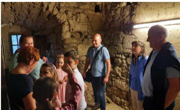
Lange Nacht der Kirche in Gnas - Turmführung